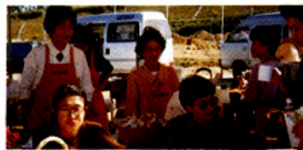
本格的なコーヒーの店を出店したグリーンふるさとフェスティバル