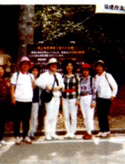
若さの証明を行った部員

あり、全員一致で話が始まりました。数日前からのぐずついた天気、特に前日はドシャブリ、当日も朝のうちは怪しげな空模様でしたが、ウキウキと朝五時に出発した部員は二十八名でした。