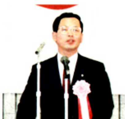
来賓祝辞をする北畑部長

午後からは、婦人部長研修会が開催され、講師には二ユービジネスの先駆者であり、米国女性経営者「百人の会」の会員で