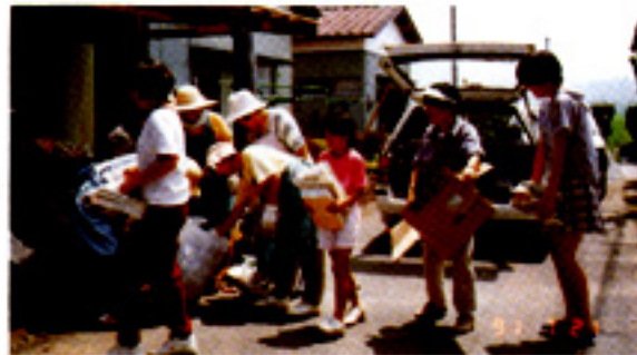
「21世紀の会」の廃品回収を協力する部員たち