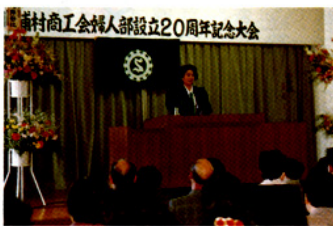
講演する桜井県婦連会長