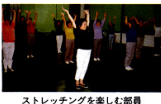
ストレッチを楽しむ部員

年目を迎え、商工会の行事や婦人部の行事に積極的に取り組んでいます。今年度は、魅力ある