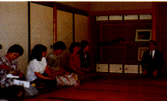
京都の妙心寺での講話から学ぶ

桜商工会婦人部は講演会を会館等で行う慣例から抜け出し、今回初夏の京都妙心寺の一室を借り、講演会を実施しました。