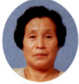
つくば市 豊里村上やす部長