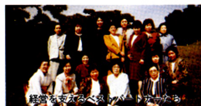
経営を支えるベストパートナーたち

話術に熱心に聞き入り、企業経営は主婦が経営を支えるベストパートナーであると話し、痛感しました。その後、研修の場を東京へと移し、東京ドーム・ビックエッグにあるピストロで、石焼きステーキに舌鼓を