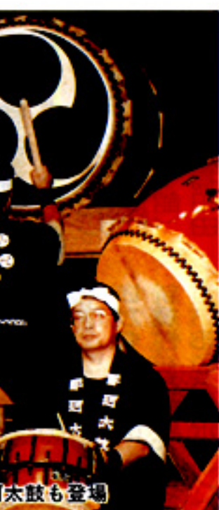
勇壮なひびきの那珂太鼓も登場