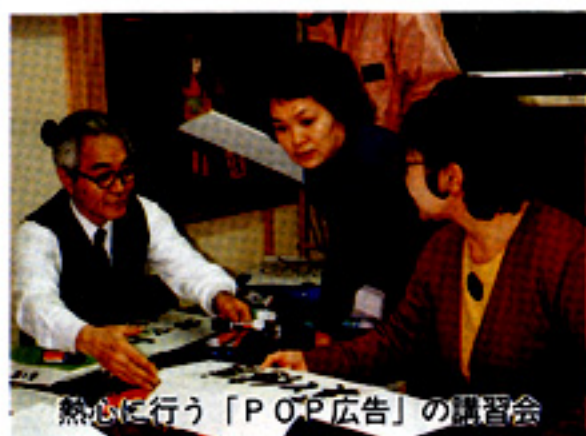
熱心に行う「POP」の講習会

大洗町商工会婦人部は、今年で設立十七年目を迎えることになりました。大洗町商工会婦人部は、今年で設立十七年目を迎えることになりました。大洗町商工会婦人部は、今年で設立十七年目を迎えることになりました。