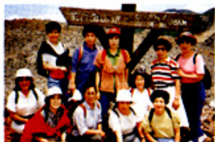
一望をめわたす頂上で記念写真

平成三年七月三日、私達は天候にも恵まれてさわやかな気分で行きました。十時頃に茶臼岳ロープウェイに