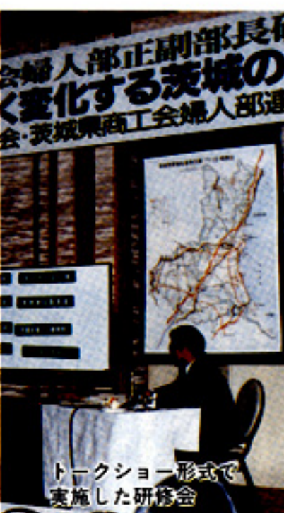
トークショー形式で実施した研究会

私は長い期間精神科医の仕事をしていまして、若い頃は患者には薬を与えれば良いという姿勢で治療に当たっていました。ところが日本でも専門家のいなかたアルコール依存治療の研究をするようになり、またいろいろな患者方と接するようになってから、何もしなくても徹底的に話を聞くことが一番大事な仕事と理解しました。今、現代社会は話しを聞くことが難しい世の中になっています。話上手な人は増えても聞き上手は少ないようです。家庭でも、職場でも自分は話さず耳を傾けることが必要ではないでしょうか。