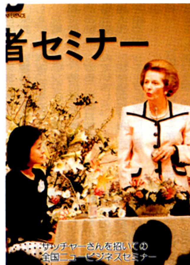
サッチャーさんを招いての全国ニュービジネスセミナー