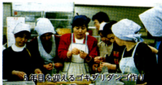
5年目を迎えるゴキブリダンゴ作り