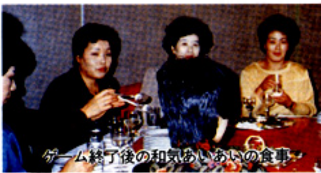
ゲーム終了後の和気あいあいの食事

を第一に、十月十八日勝田市の勝田パークホテルにて、ボーリング大会を行いました。金曜日の夜ということもあり、順番待ちの人も多く、順番待ちの間も音ばかりが響く中、久しぶりのボーリングにドキドキしながらゲームを始めました。昔とつた杵づか、と思いきや、ボールは思うように行つてはくれ