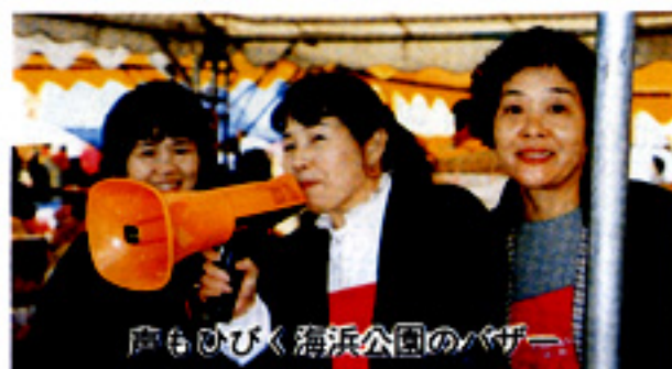
鹿嶋市海浜公園のバザー

今年度は新都庁見学と西伊豆、箱根方面への研修旅行を始め、講演会、研修会等々、楽しく活動を進めております。中でも商工寮へ