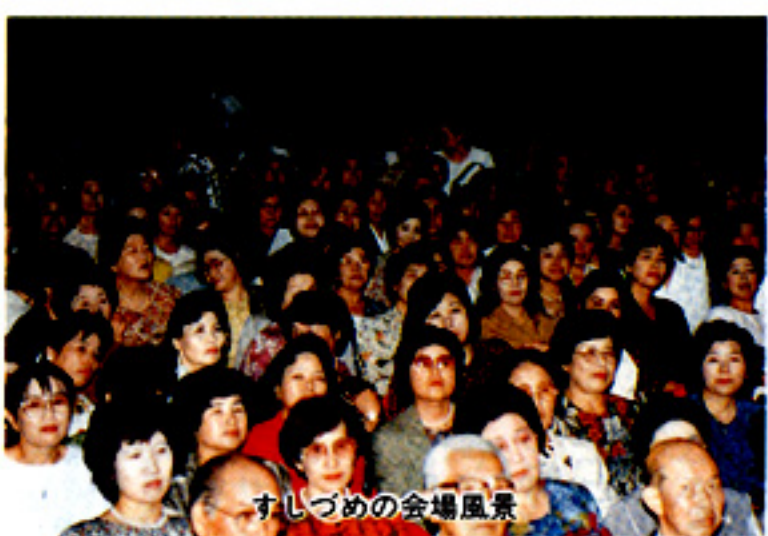
すしづめの会場風景

県商工会婦人部連合会は一、二、三、四、五、六、七、八、九、十、十一、十二、十三、十四、十五、十六、十七、十八、十九、二十、二十一、二十二、二十三、二十四、二十五、二十六、二十七、二十八、二十九、三十、三十一、三十二、三十三、三十四、三十五、三十六、三十七、三十八、三十九、四十、四十一、四十二、四十三、四十四、四十五、四十六、四十七、四十八、四十九、五十、五十一、五十二、五十三、五十四、五十五、五十六、五十七、五十八、五十九、六十、六十一、六十二、六十三、六十四、六十五、六十六、六十七、六十八、六十九、七十、七十一、七十二、七十三、七十四、七十五、七十六、七十七、七十八、七十九、八十、八十一、八十二、八十三、八十四、八十五、八十六、八十七、八十八、八十九、九十、九十一、九十二、九十三、九十四、九十五、九十六、九十七、九十八、九十九、一〇〇、一〇一、一〇二、一〇三、一〇四、一〇五、一〇六、一〇七、一〇八、一〇九、一一〇、一一一、一一二、一一三、一一四、一一五、一一六、一一七、一一八、一一九、一二〇、一二一、一二二、一二三、一二四、一二五、一二六、一二七、一二八、一二九、一三〇、一三一、一三二、一三三、一三四、一三五、一三六、一三七、一三八、一三九、一四〇、一四一、一四二、一四三、一四四、一四五、一四六、一四七、一四八、一四九、一五〇、一五一、一五二、一五三、一五四、一五五、一五六、一五七、一五八、一五九、一六〇、一六一、一六二、一六三、一六四、一六五、一六六、一六七、一六八、一六九、一七〇、一七一、一七二、一七三、一七四、一七五、一七六、一七七、一七八、一七九、一八〇、一八一、一八二、一八三、一八四、一八五、一八六、一八七、一八八、一八九、一九〇、一九一、一九二、一九三、一九四、一九五、一九六、一九七、一九八、一九九、二〇〇、二〇一、二〇二、二〇三、二〇四、二〇五、二〇六、二〇七、二〇八、二〇九、二一〇、二一一、二一二、二一三、二一四、二一五、二一六、二一七、二一八、二一九、二二〇、二二一、二二二、二二三、二二四、二二五、二二六、二二七、二二八、二二九、二三〇、二三一、二三二、二三三、二三四、二三五、二三六、二三七、二三八、二三九、二四〇、二四一、二四二、二四三、二四四、二四五、二四六、二四七、二四八、二四九、二五〇、二五一、二五二、二五三、二五四、二五五、二五六、二五七、二五八、二五九、二六〇、二六一、二六二、二六三、二六四、二六五、二六六、二六七、二六八、二六九、二七〇、二七一、二七二、二七三、二七四、二七五、二七六、二七七、二七八、二七九、二八〇、二八一、二八二、二八三、二八四、二八五、二八六、二八七、二八八、二八九、二九〇、二九一、二九二、二九三、二九四、二九五、二九六、二九七、二九八、二九九、三〇〇、三〇一、三〇二、三〇三、三〇四、三〇五、三〇六、三〇七、三〇八、三〇九、三一〇、三一