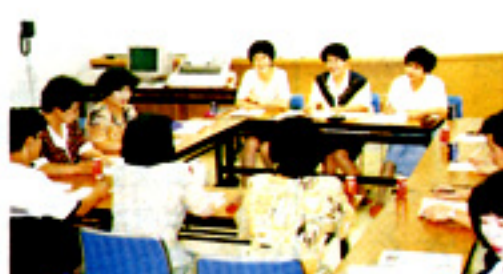
熱気あふれる委員会