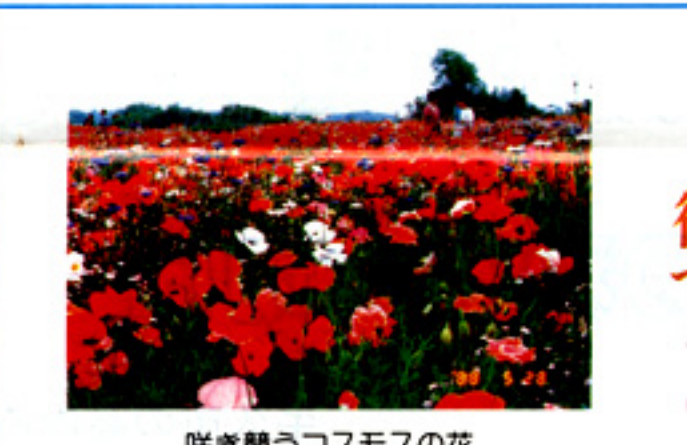
咲き競うコスモスの花