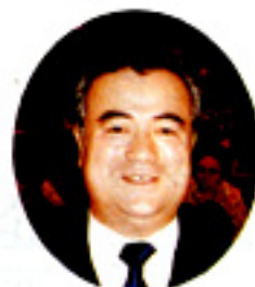
来賓祝辞の 橋本知事