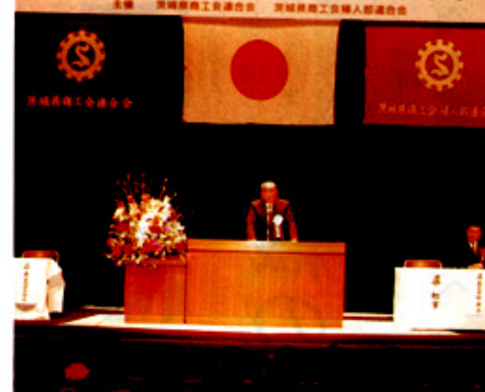
あいさつを行なう常井県連会長