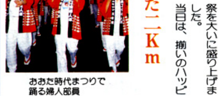
おた七時代まつりで踊る婦人部員

この祭は、平安時代から当地を支配していた佐竹の武者行列や、テレビでお馴染みの水戸黄門一行を再現したもので、今年は警察署、消防や少年剣士も加わり、総勢二〇〇人のパ