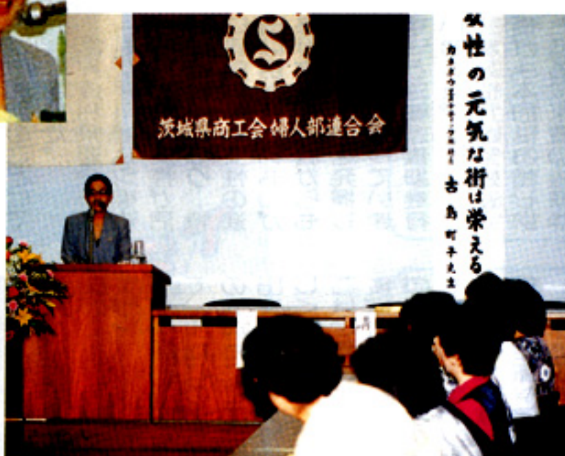
講義に真剣に耳を傾ける部員