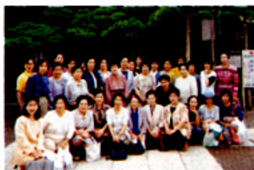
柴又帝釈天での部員一行

銚田町商工会婦人部は、昭和五十四年三月に設立され、現在百十二人で活動しています。