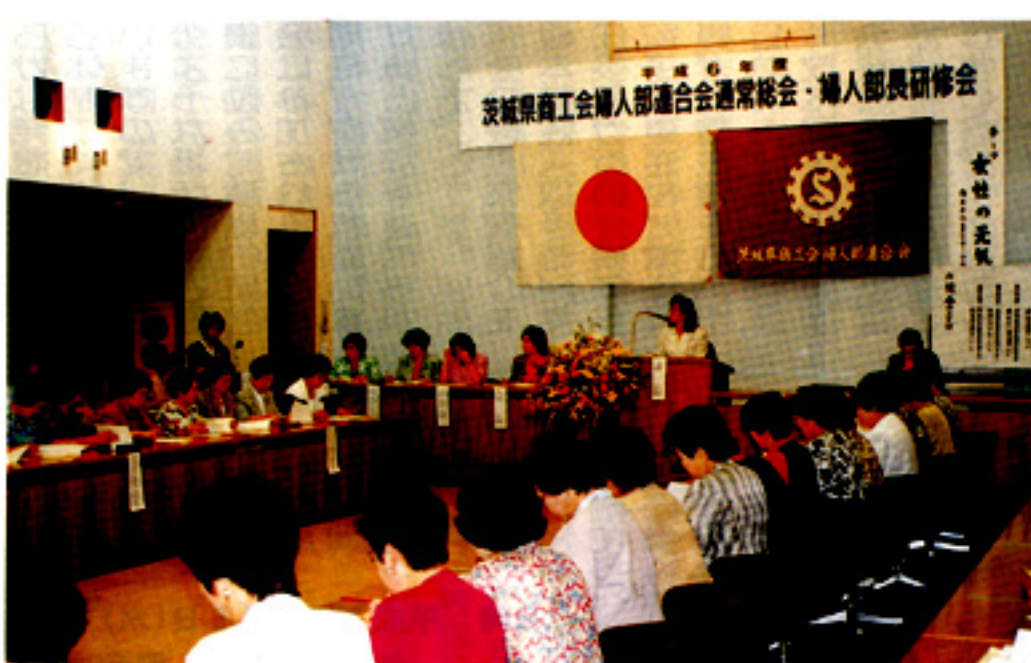
110名が参加した通常総会

とらえて商売をしていると完全に世の中から遅れてしまいます。全く価値観が違っています。物が売れない今大切なのは、不況と言いついて片づけず企業努力を怠らない事です。八十年代の女性は仕事の内容を選ばなかつた。今は総人口の五十二%が働いている。主婦の七十%が仕事をもち時代。栄えている町は地域の女性の労働人口が多い。経済力があると町は栄えます。