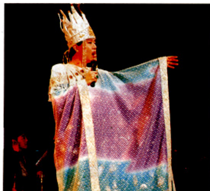
目をみはる衣装で部員達を魅了した美川憲一

休憩後、歌手として二十年のキャリアを持ち、軽妙な語り口と派手な衣装で婦人部世代に圧倒的人気を誇る美川憲一（ショウ）が行われました。構成は、オーブニングから始まる「さそり座の女」などのヒット曲やシャンソンなどエンディングまで二十一曲を歌い、紅白歌合戦で着用した三度の華麗な衣装変えを含めてあつと云う間の一時間三十分でした。