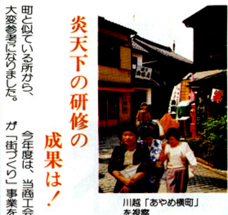
川越「あやめ横町」を視察

千代田町商工会婦人部は、毎年日帰りで先進商業施設や町並みの視察を続けています。今年、は「小江戸」といわれる歴史を残した川越市の町並みを視察しました。