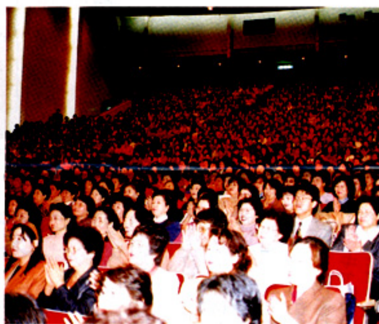
熱気ムンムンの会場内

らかな発想を取り入れる体制づくりを進めていますので、皆様がこのような場所での自己研鑽に励み、積極的に社会に参加されることに期待が寄せられています」と祝辞を述べられました。