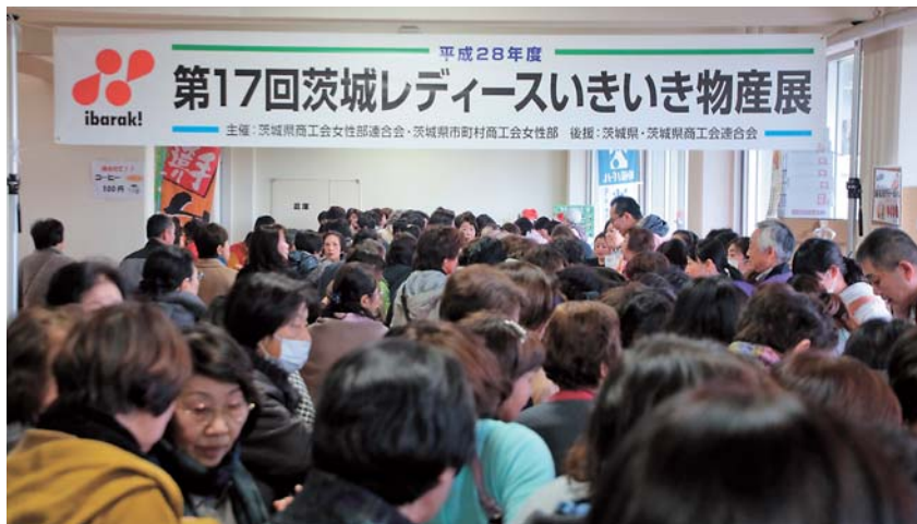
大賑わいの物産展会場

各地域の特色を活かした産品を一堂に集め、地域特産品等を広くPRするとともに、ビジネスパートナー探し、場として活用することを目的とした第17回茨城県レディースいきいき物産展を12月7日(水)、水戸市県民文化センターにて開催した。県内42事業者が厳選されたこだわりの特産品やその地域でしか手に入らない逸品など200品目が販売された。