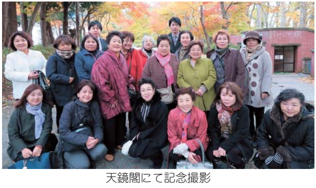
天鏡閣にて記念撮影

商工会青年部・女性部全国組織化50周年記念式典、第18回商工会青年部・女性部全国大会が11月8日、9日に福島県郡山市で開催された。 1日目の大会には茨城県内から青年部員200余人、女性部員80余人が参加し、全国各地より約5000人の青年・女性部員が福島県の天鏡閣にて記念撮影