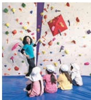
笠間市八雲二丁目 6-2 ☎0296-71-4211

ボルテックスは、JR常磐線の友部駅より徒歩5分の駅近にあり、東京五輪の正式種目にも認定され、注目を浴びているボルダリングを楽しむ施設です。ボルダリングは、約4mの壁一面に設置されたカラフルな石(ホールド)を使い壁を登るスポーツで、大人も、子どもも一緒に楽しく頭と体と心を鍛えることが出来ます。アットホームな雰囲気の中で、初めての方でも出来るよう登り方のコツやマナー、楽しみ方など教えています。