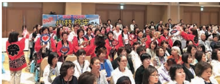
茨城県の熱の入った応援団

賞した。最優秀賞を受賞した小林さんは、11月6日に兵庫県神戸市で開催される全国大会に代表として出場する。その後、衆議院議員 甘利明氏の基調講演があり、表彰式の後に閉会した。次年度は新潟県で開催される。