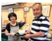
笠間市上郷1162 ☎080-3724-1162 (予約優先:前日までの電話予約は17時~20時に)