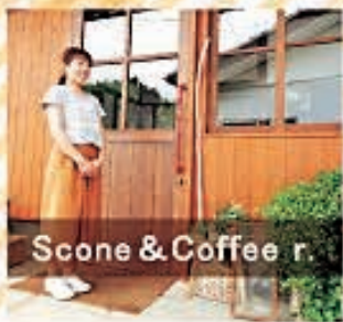
Scone & Coffee r.

焼きたてのスコーンやマフィン。ハンドドリップで丁寧に淹れるコーヒーなどを里山の景色を見ながら、ゆっくり楽しんでいただきたいと思います。