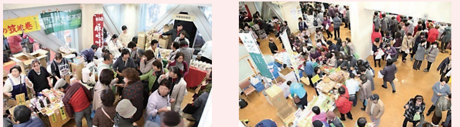
昨年の物産展の様子