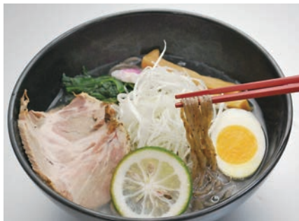
商工会女性部と共同開発した粉コンニャク入り「藤右衛門らーめん」

昨年、弊社は3代目が社長に就任し、代替わりを果たしました。とはいえ、急に仕事を引き継ぐことが出来るわけもなく、1年間は名ばかり社長。会長（前社長）が今までと同様の社長業をしていたというのが実情でした。しかし、名ばかりといっても社長は社長。「地位が人を作る」という事なのか、1年経った現在では大部分の引継ぎが出来ました。弊社の場合は仕事の引継ぎよりも肩書の引継ぎを優先した事が良かったのだと思います。代替わりには勢いと思い切りが大切なかもしれませんね。