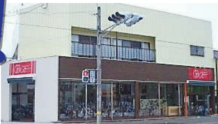
セーフティショップおおしま