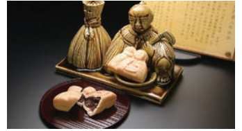
イチオシ商品「農人形の形の最中」

店舗所在：茨城県東茨城郡茨城町常井 675-22 営業時間等：8:30 ~ 19:00 (火曜定休) ※営業時間・定休日は変更となる場合がございます。