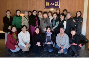
まに寄り添い、さまざまな地域貢献活動に取り組んでいきます。(大塚 良江 記)

また、秋に山形県にある銀山温泉へ、一泊で親睦研修会を開催いたしました。初めて参加してくださった部員もおりまして、バスの中は夕食時などはゲームをするなど、部員間の親睦交流ができました。今後も部員交流を深めていき、部員増強に繋げられるよう、部員一同努めて参ります。