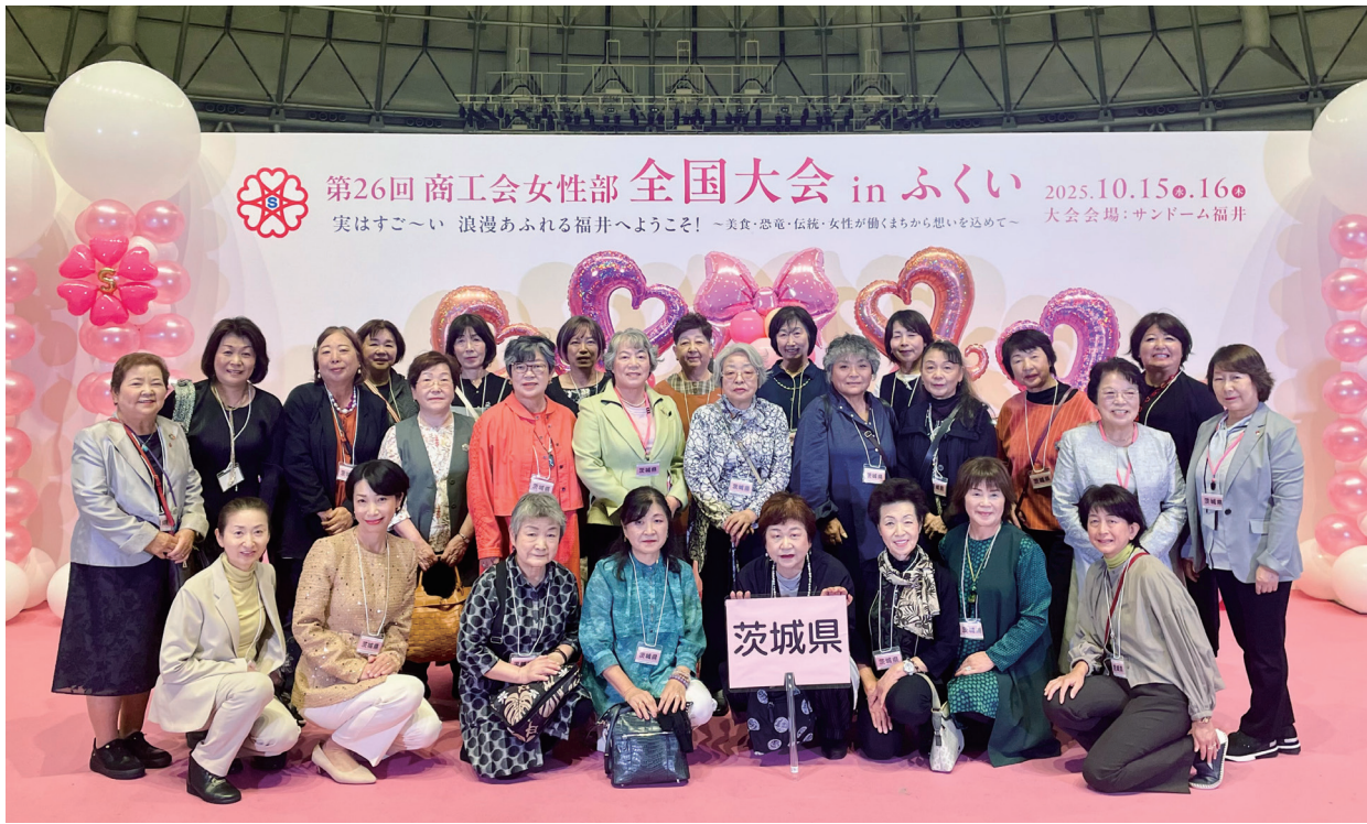
第26回 商工会女性部 全国大会 in ふくい 2025.10.15・16 実はずこ〜い 浪漫あふれる福井へようこそ! ~美食・恐竜・伝統・女性が働くまちから想いを込めて~ 大会会場: サンドーム福井