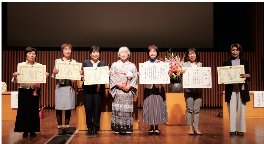
宮本会長と発表者のみなさん